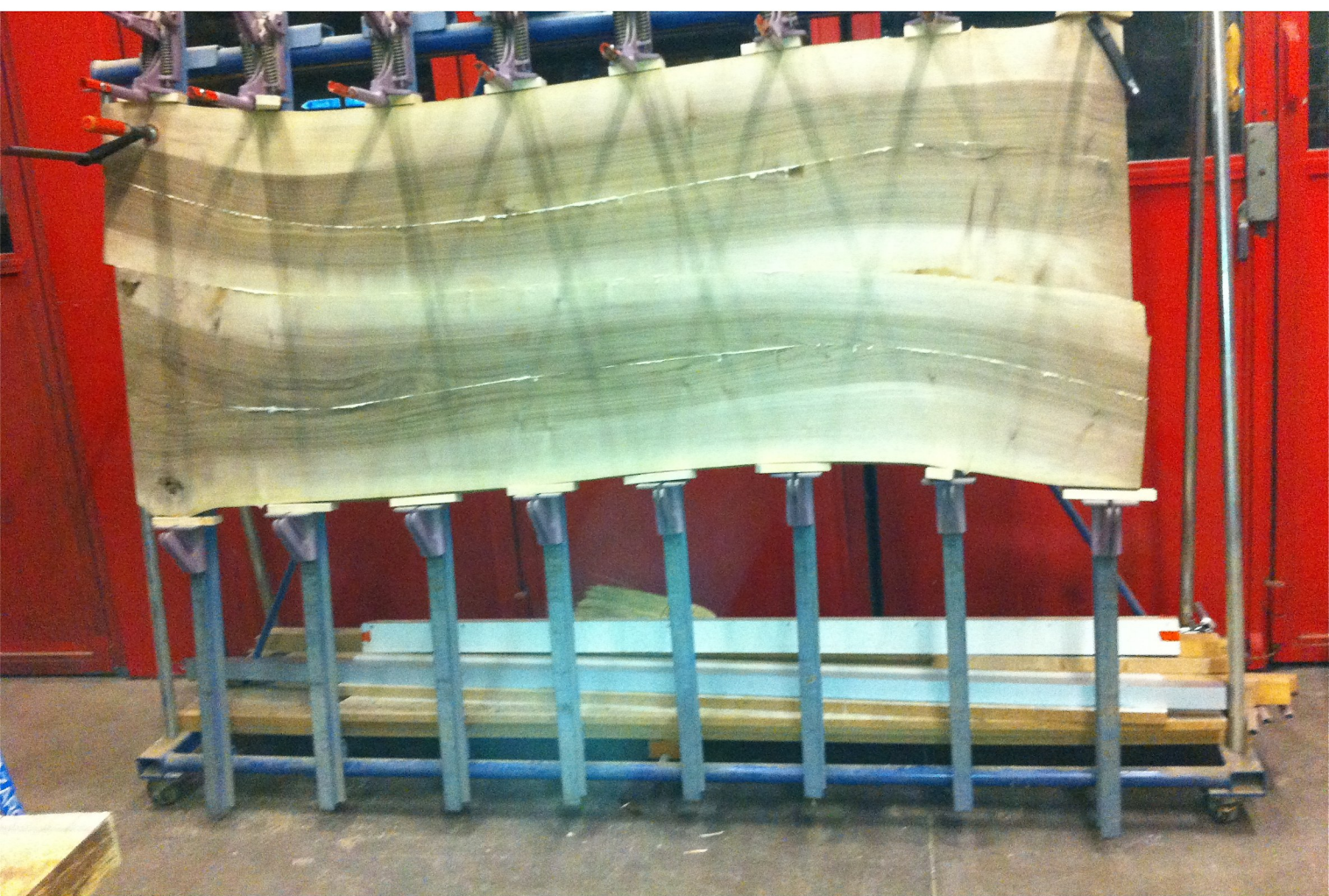
Der Verleimständer presst die Leimflächen aufeinander