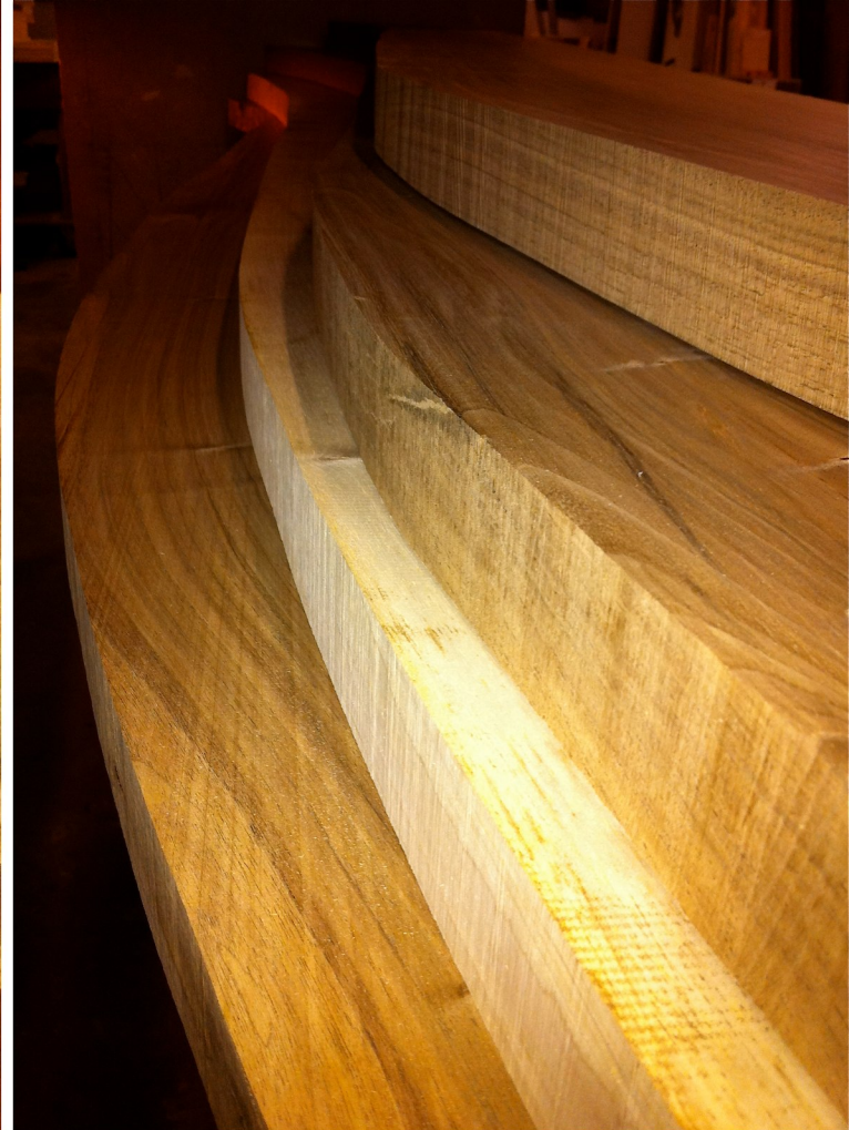
Die Konturen der vier Bretter sind sichtbar