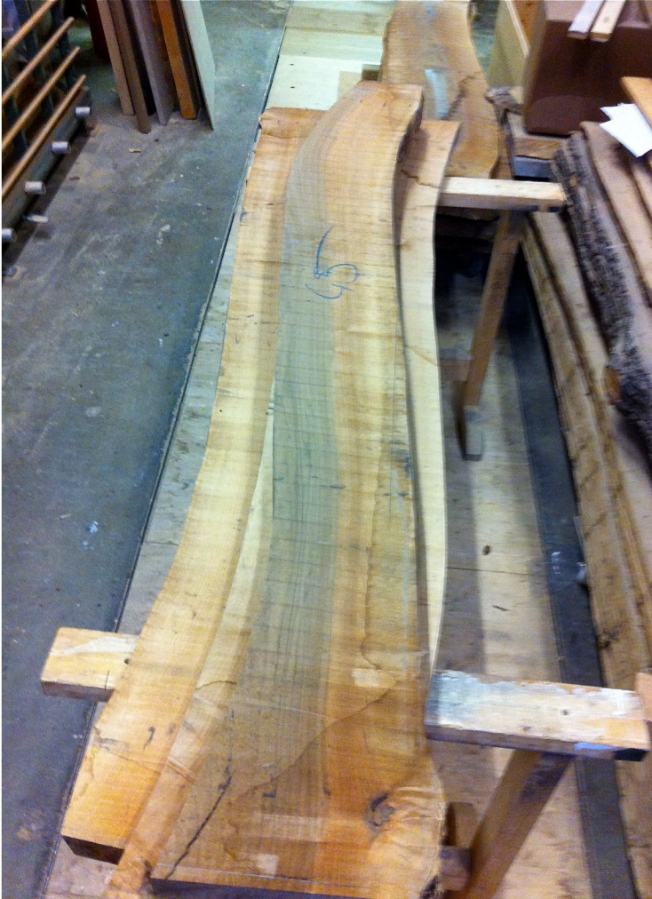
Trennschnitt - ergibt 4 Einzelbretter