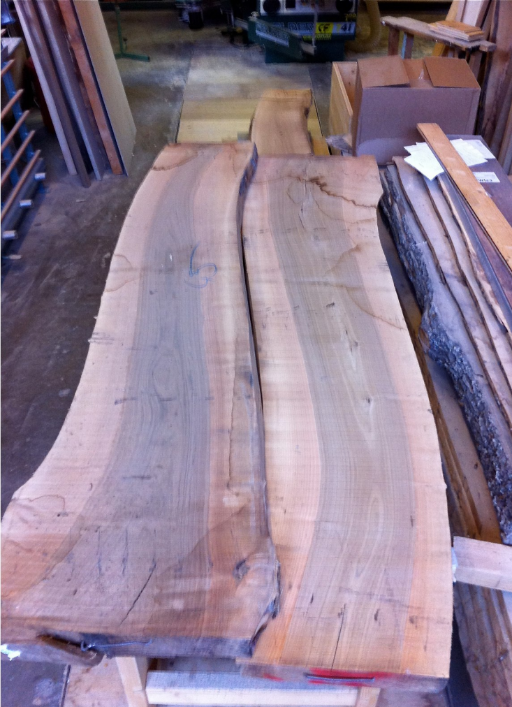
Unbearbeitete Bretter aus dem Holzlager