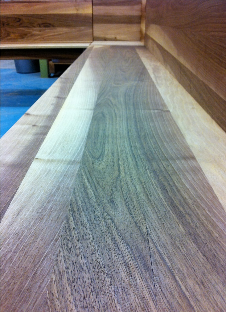
Der Sitzbank - erarbeitet aus demselben Nussbaum wie der Tisch