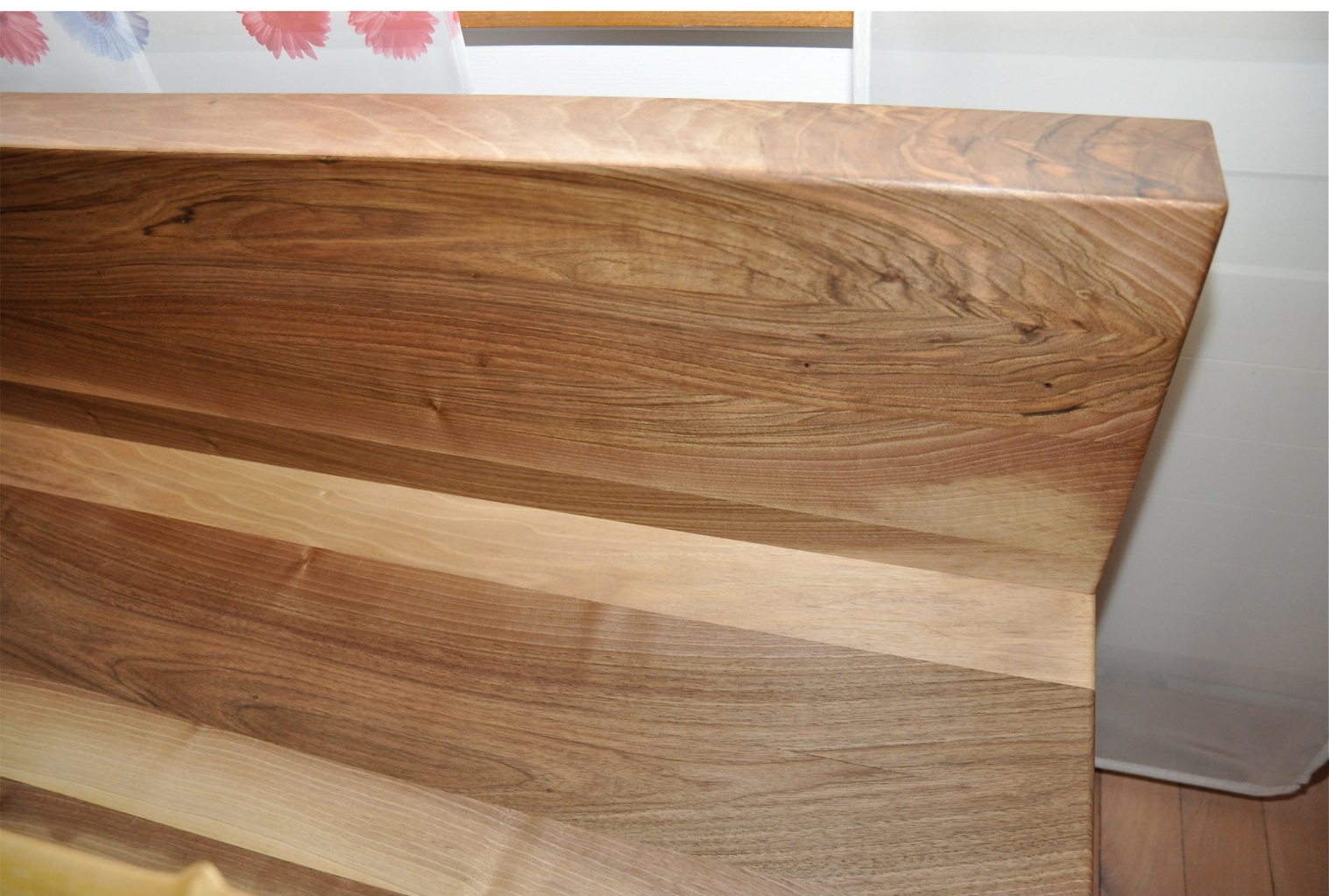
Lehne und Sitzbank des Ecktisches