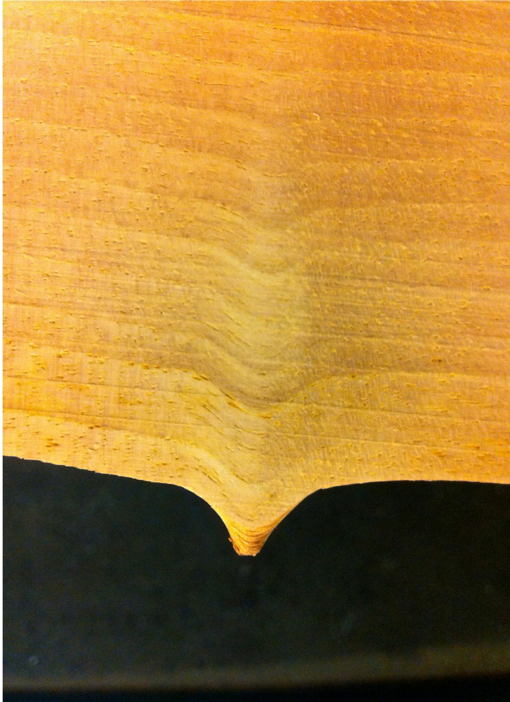
Wunderschönes Detail - eine nicht ausgewachsene Knospe am Stamm