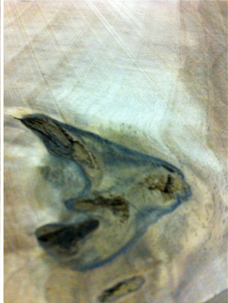
Nach dem Hobeln kommen zwei Äste zum Vorschein