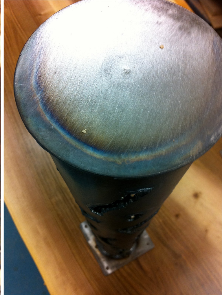
Die Stahlrohrbeine des Tisches