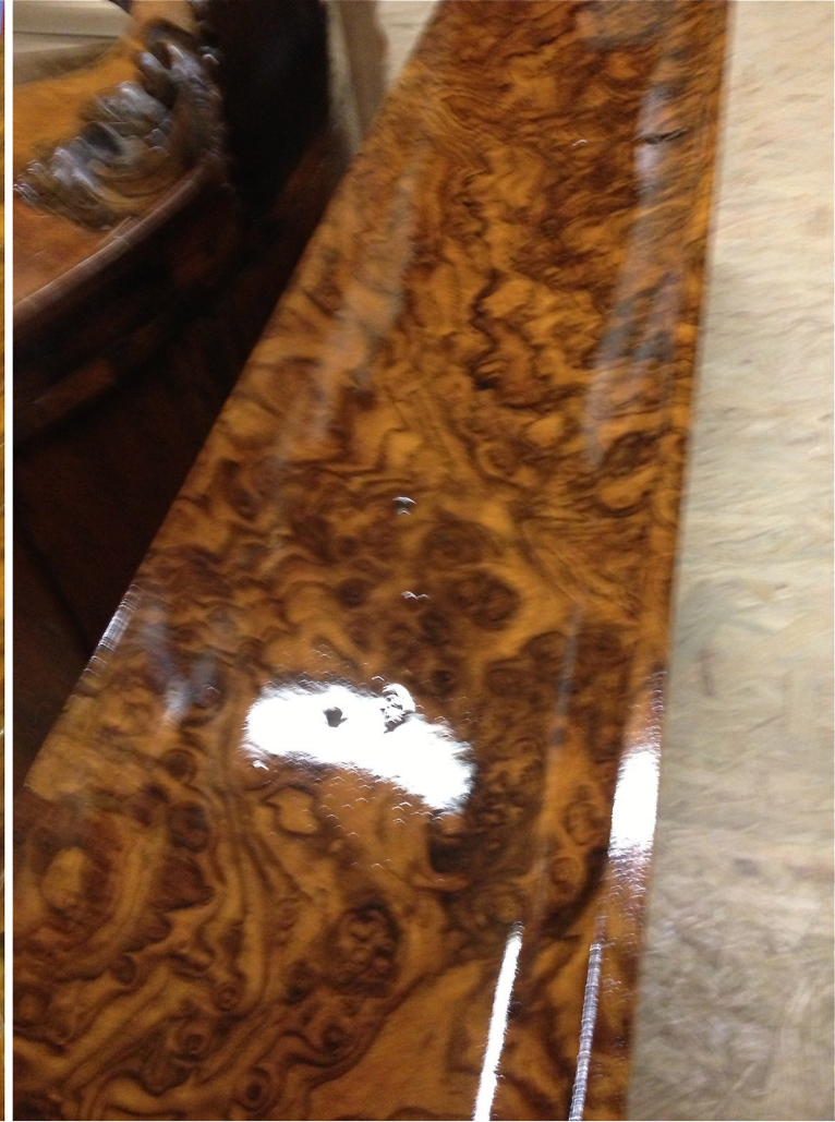
2. und 3. Auftrag des Gellacks