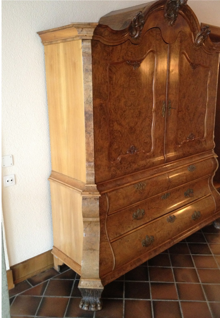
Vor Beginn der Renovation (aussen) und Restauration (innen)