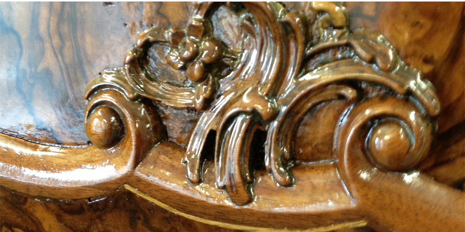
Wunderschönes Ornament decoupiert und handgeschnitzt