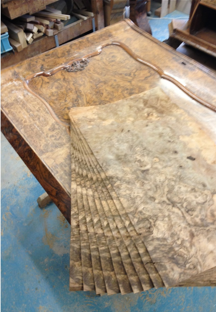
Ausgesuchte Nussbaum-Stockmasefurniere für die Neufurnierung der Seitenteile und diverse kleinere Ergänzungen