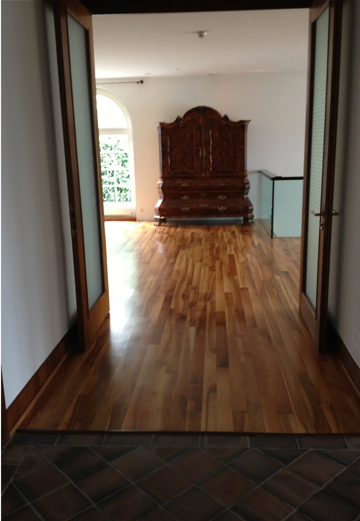
Vom Entrée zum Korridor - ein schöner Blickfang