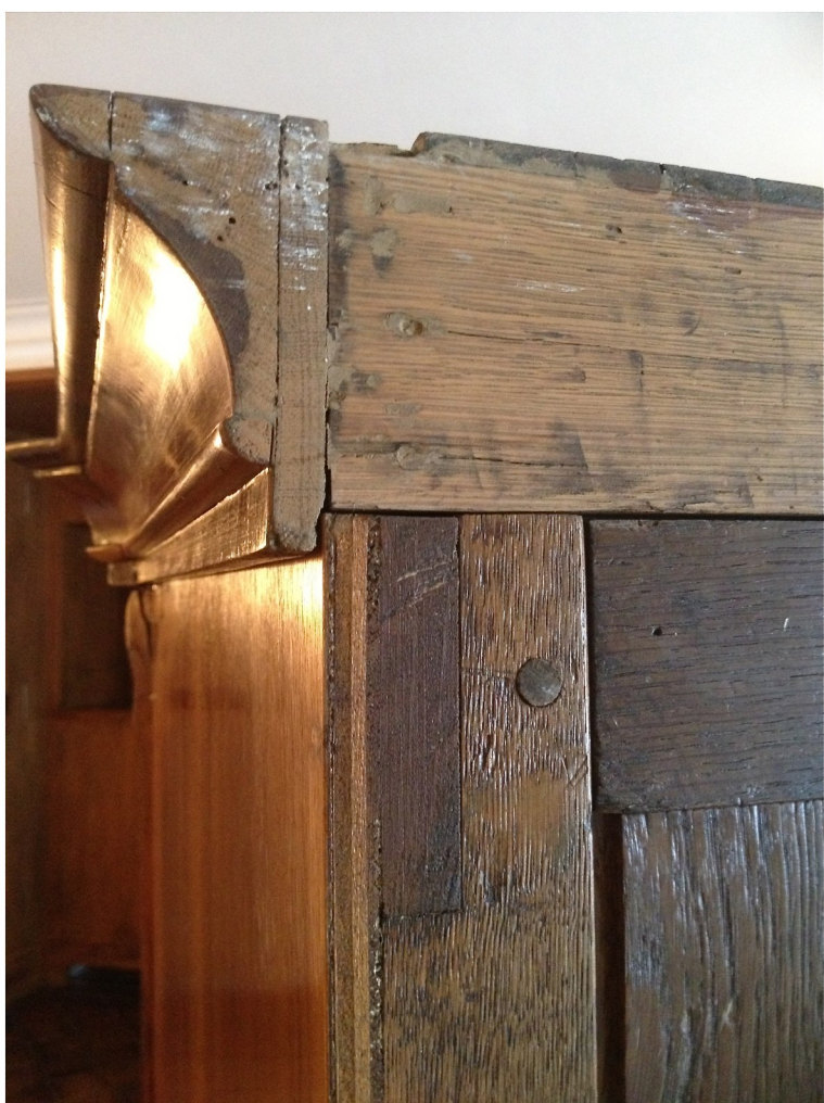
Rückansicht mit Kranzprofil und Verbindungselementen