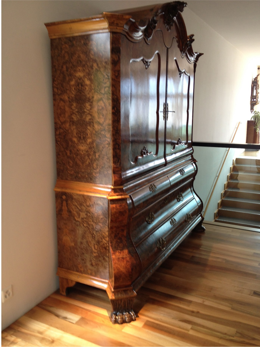
Barock im Gubel