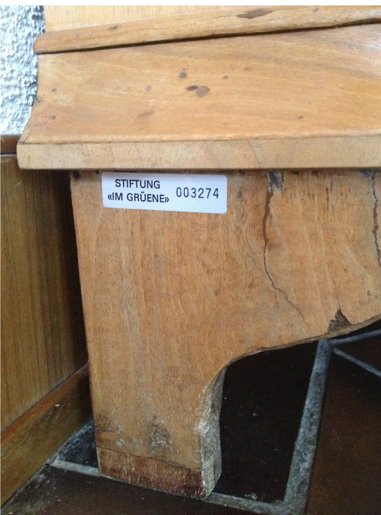
Hinterer Fuss und Sockelpartie