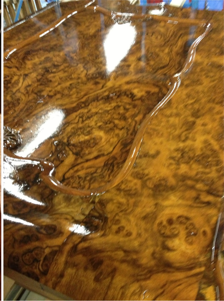
Oberflächenbeschichtung mit Gellack: Links: Grundauftrag mit Öl - Rechts: 1. Gellack-Auftrag