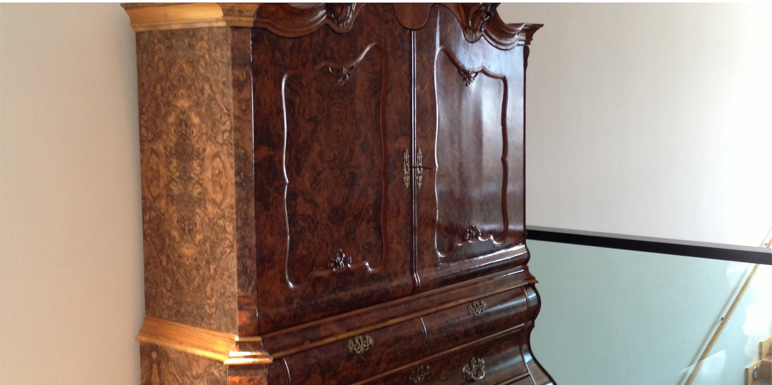
Neu furnierte Schrankseite mit sehr schön gelungenem Kreuzbild