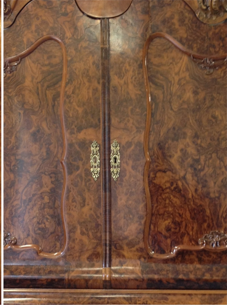
Schlüsselschild-Partie vorher (links) und nachher (rechts)