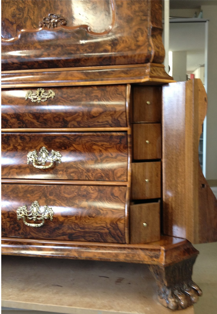
Die sogenannten Geheimfächer links und rechts in der Schrankseite werden mit einem sehr einfachen aber genialen Verschluss abgeschlossen