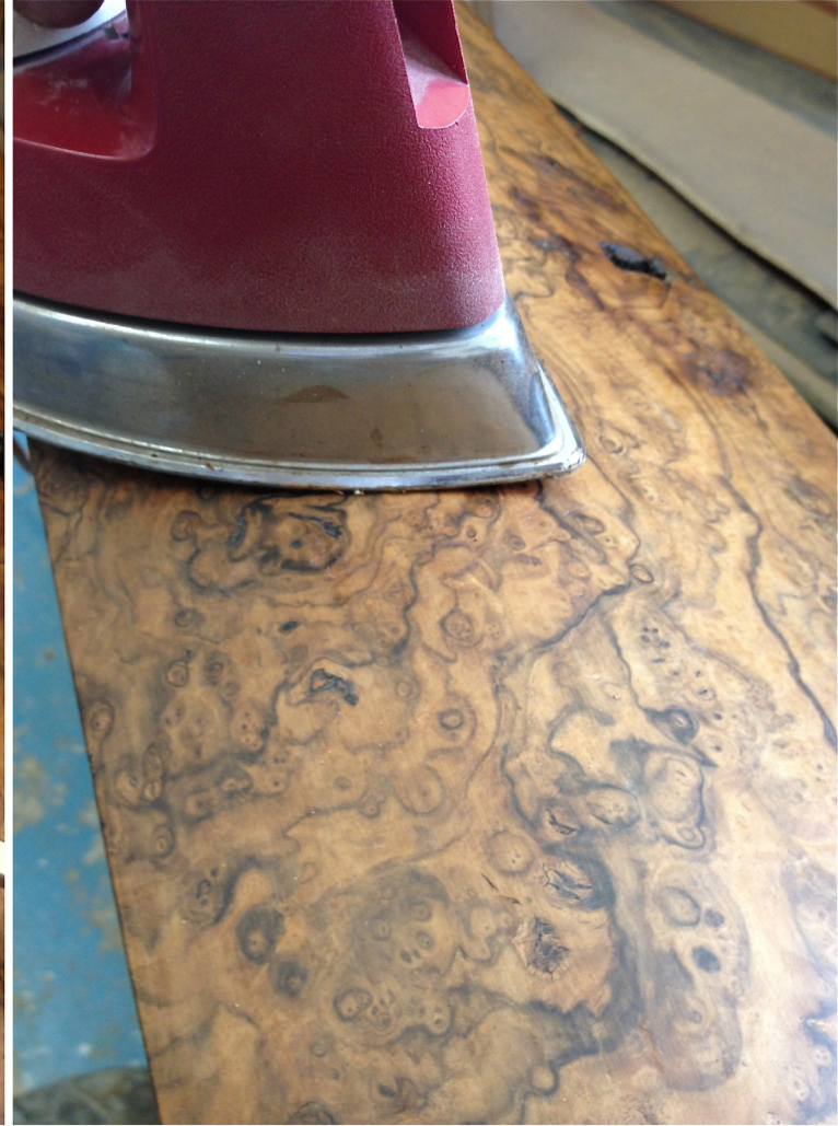
Lose Teile werden geleimt und mit dem heissen Bügeleisen festgeleimt